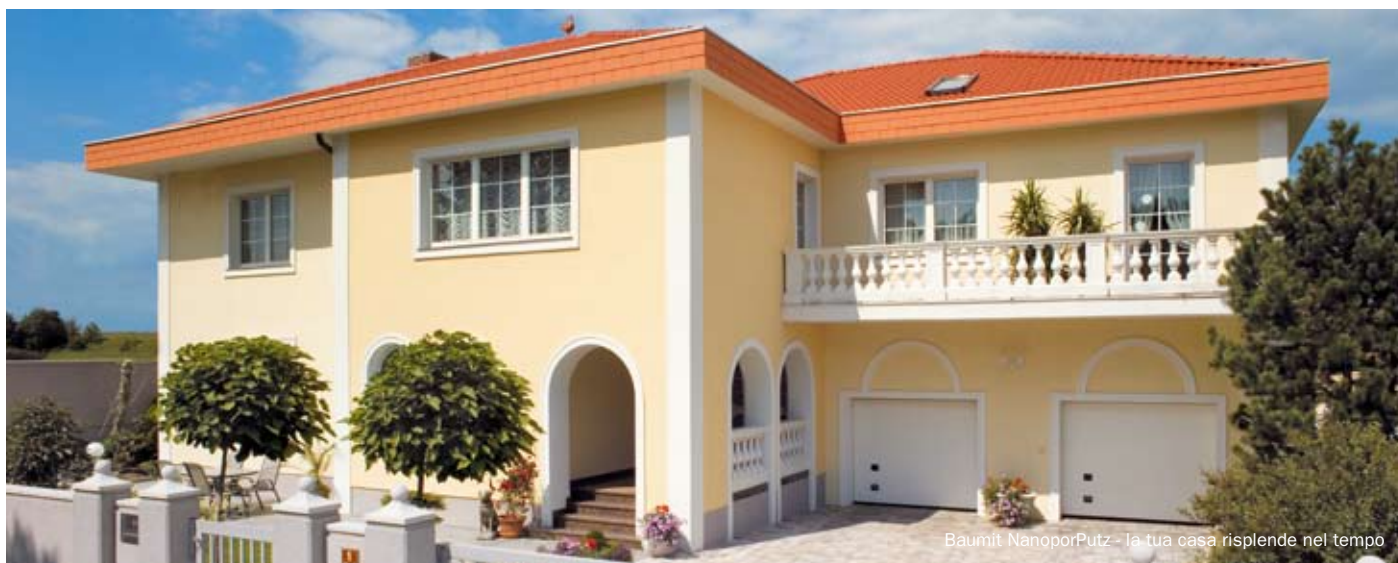
Baumit NanoporPutz - la tua casa risplende nel tempo

Coniugando un'esperienza pluriennale con le più recenti scoperte delle nanotecnologie, Baumit ha sviluppato e brevettato un prodotto «antietà» per facciate: Baumit NanoporPutz. La sua superficie speciale conferisce alla facciata pulizia e bellezza che durano nel tempo, così che la vostra casa risplenderà per anni nella sua bellezza originaria.